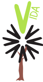
Fundación Galega Contra o Narcotráfico